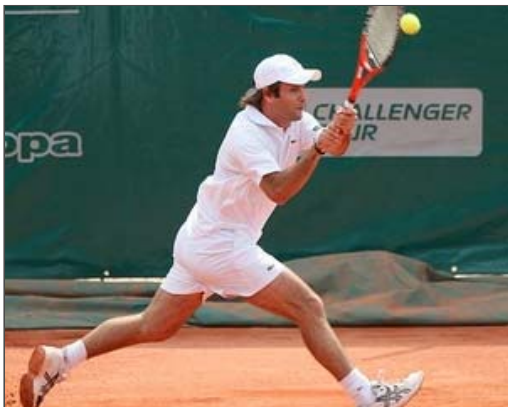
Fabrice Santoro avait découvert le tournoi de Primrose en 1989, à 16 ans